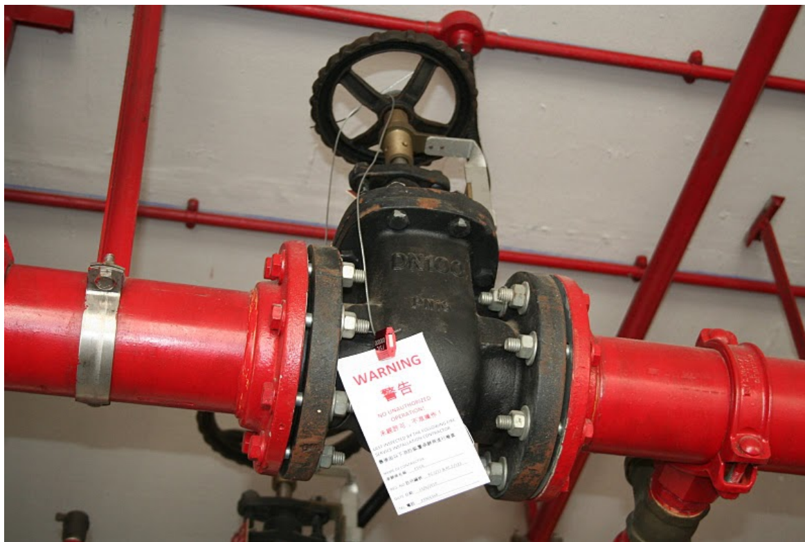
常用的花灑分層閘掣繫穩方法