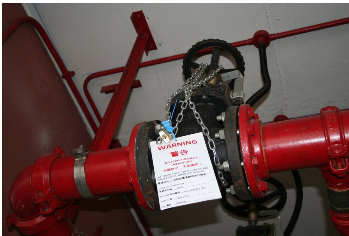
常用的花灑分層閘掣繫穩方法