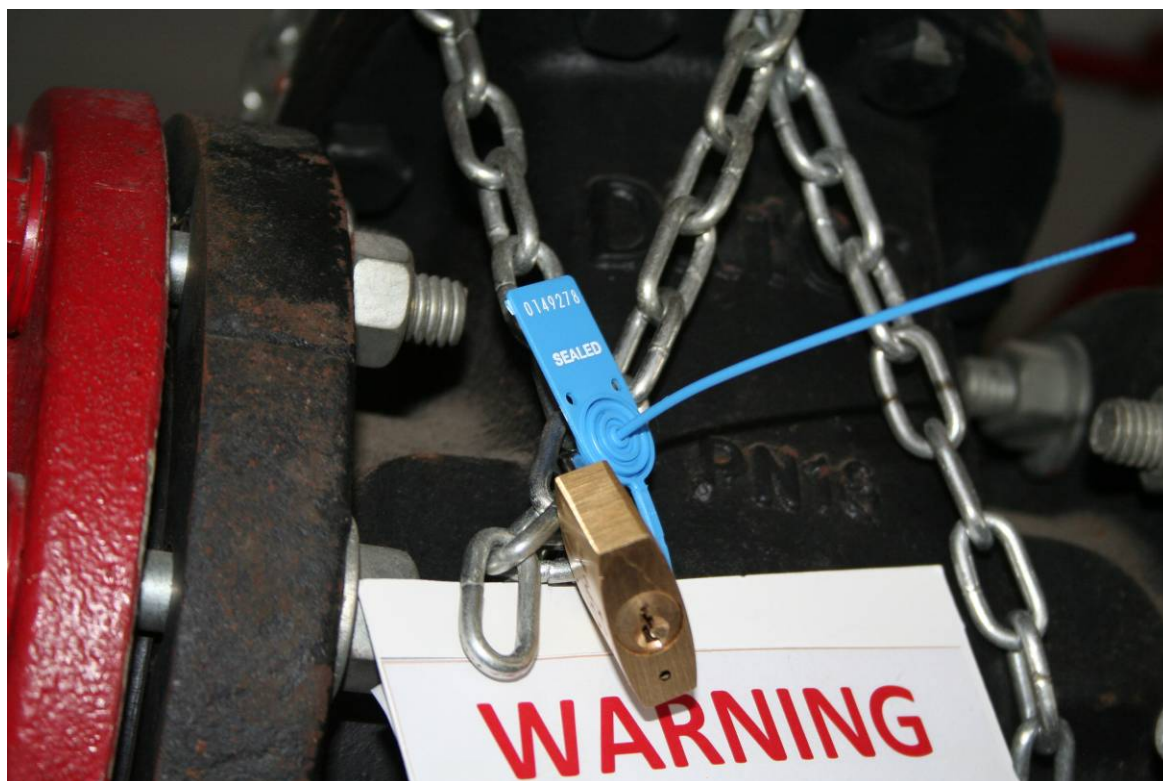
防干擾保險牌子樣本