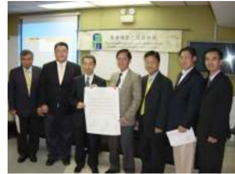
消防商會聯同其他五個創會商會代表會員進行簽署儀式，標誌對「調解為先」的承諾。

，調解(Mediation)會是理想的方案。於2011年中，消防商會接受FEMC邀請聯同其他五個創會商會代表會員進行簽署儀式，標誌對「調解為先」的承諾。